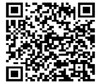
守山探検隊 まちあるきマップ