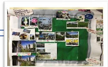
ウォークラリー第3弾の 掲示板